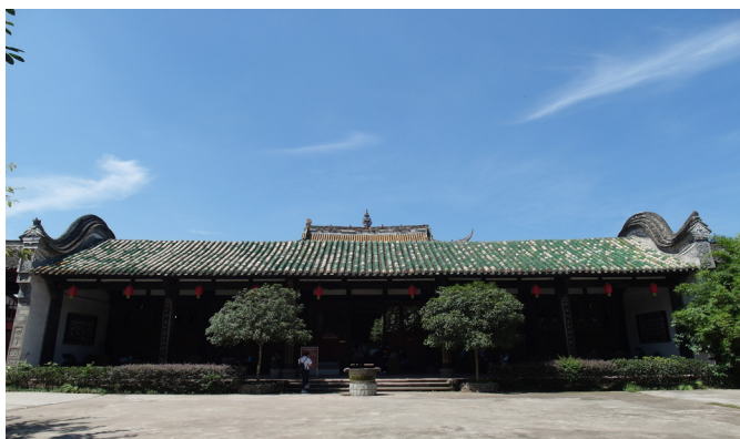
圖 5 廣東會館