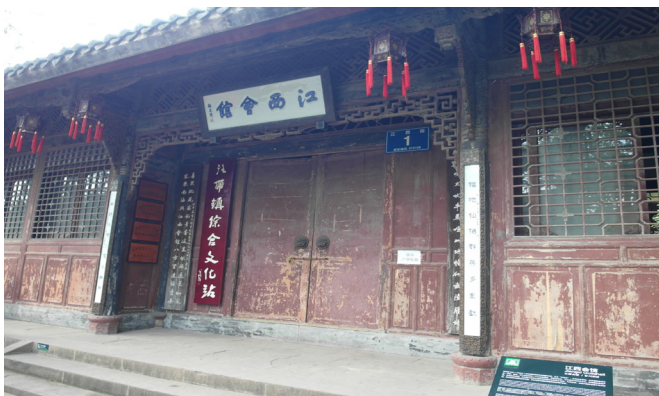
圖 4 江西會館