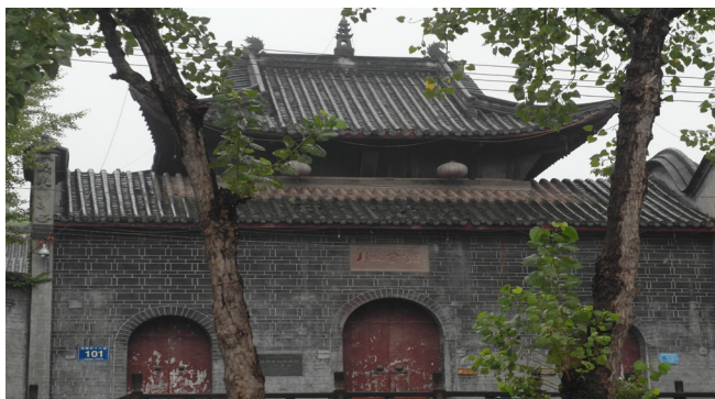
圖 6 川北會館