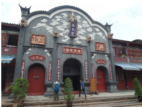
圖 3 湖廣會館